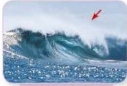
cresta de la ola

Fijate bien en los diferentes significados de la palabra cresta :