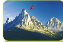
cresta de la montaña

Las palabras que tienen varios significados se llaman palabras polisémicas .