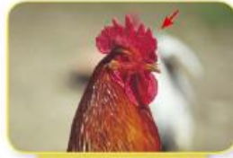
cresta del gallo